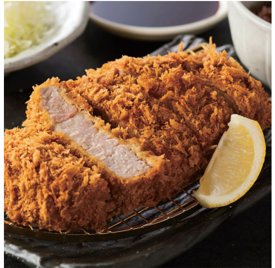
厚切りローズかつ定食 2,180円