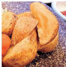
もちろん国産! ホクホク! ポテトフライ 170円