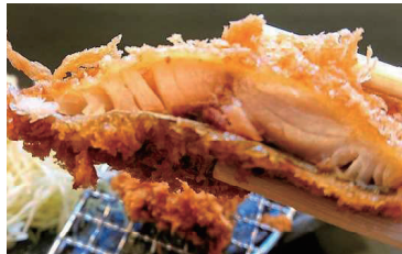
ふわふわの食感! あじフライ(半身) 160円