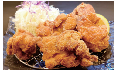
国産鶏もも肉 からあげ 3個 300円 5個 480円