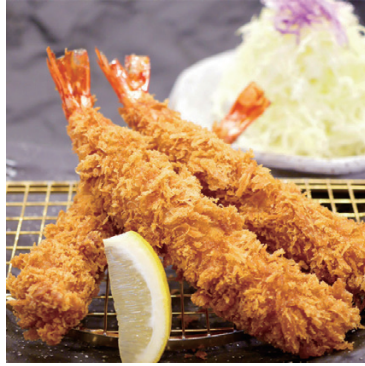
ごいっしょに、ぜひ! 大えびフライ (1本) 560円