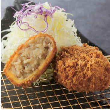
人気No.1 まるかつコロツケ 250円