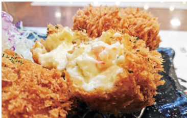
えびクリームコロツケは 別メニューを ご覧ください