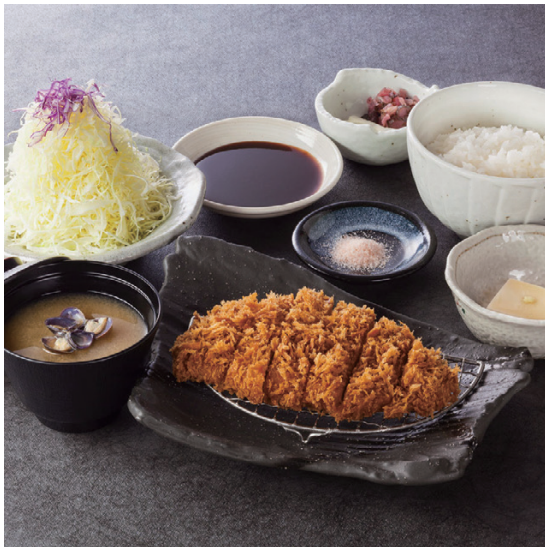
ローズかつ定食 ローズかつ(120g) 1,610円