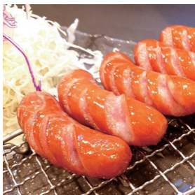
基本みんな大好き! ケチャップで! ウインナー (4本) 280円