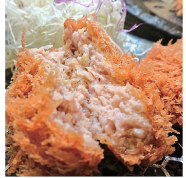
ぺろりといける ミンチかつ 170円