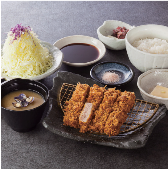
ヒレかつ定食 ヒレかつ(120g) 1,720円