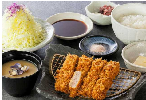
Pork Fillet Cutlet set 猪柳炸猪排套餐 돼지 등심 치즈 카츠 정식 히레かつ定食(히레かつ120g) 1,980円