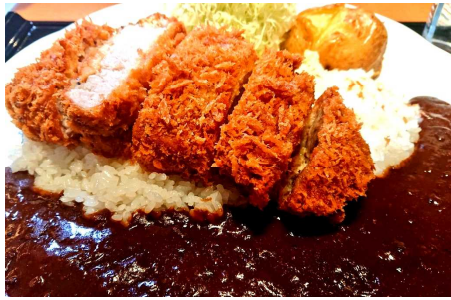
Thick Pork Loin Cutlet Curry 厚切猪排咖喱 두꺼운 돈가스 카레 厚切りロースかつカレー 2,470円