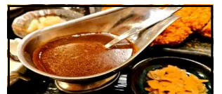
Curry sauce 咖喱酱 카레 소스 ちよっとカレー 250円