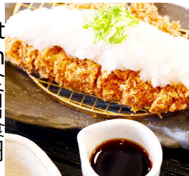
Pork loin cutlet set with grated radish 大根泥汁猪排定食 무생채 소스를 얹은 돈가스 정식 오ろ시로스かつ定食 2,050円