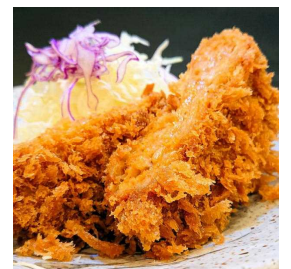
Minced meat cutlet 碎肉炸猪排 미트 치즈 민치かつ 190円