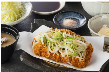
Pork loin cutlet set with Onions Marinated in Dashi-flavored Salt 加入了高汤盐调味的洋葱片的猪排定食 다시물 소금으로 맛을 낸 양파를 얹은 돈가스 정식 ねぎ塩로스かつ定食 2,050円