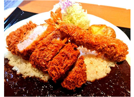
Curry with Thick Pork Loin Cutlet and Large Shrimp Fry 厚切猪排和大虾炸咖喱 두꺼운 돈가스와 큰 새우튀김 카레 大えびフライ&厚切りロースかつカレー 3,100円