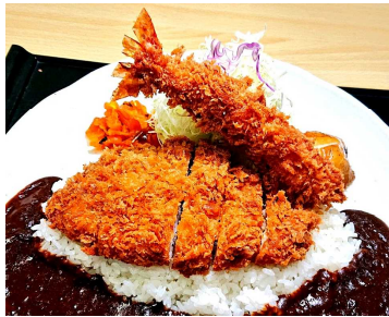
Curry with Pork Loin Cutlet and Large Shrimp Fry 猪排和大虾炸咖喱 돈가스와 큰 새우튀김 카레 大えびフライ&로스かつカレー 2,000円