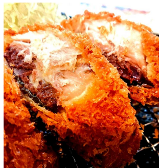
Horse mackerel fry 鯖鱼炸 고등어튀김 あじフライ 360円