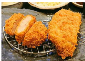
Pork loin cutlet(80g) and pork fillet cutlet(60g) set 猪里脊肉和猪里脊肉炸猪排定食 돼지 등심 돈까스와 돼지 안심 돈가스 정식 로스&히레かつ定食 2,300円