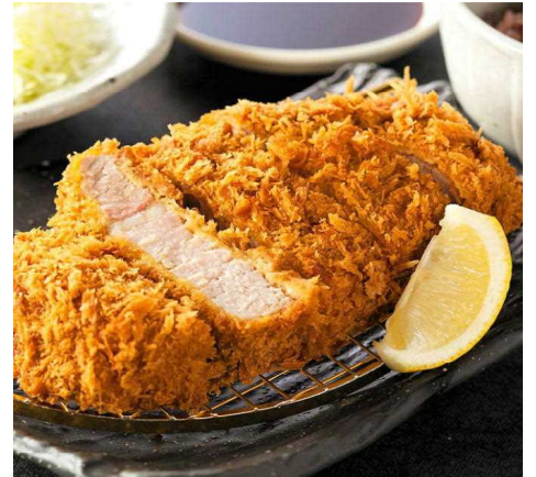
Thick pork cutlet set 厚切猪排套餐 두께 있는 돈가스 정식 厚切り로스かつ定食(로스かつ210g) 2,630円