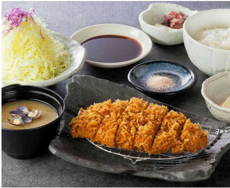
Pork loin cutlet set 猪排套餐 돈가스 정식 로스かつ定食(로스かつ120g) 1,930円

정식에는 밥, 양배추, 조개국, 참깨 두부, 김치가 포함되어 있습니다. 밥, 양배추, 조개국은 무한리 필입니다