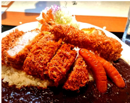
Curry with Thick Pork Loin Cutlet, Large Shrimp Fry, and Sausages 厚切猪排、大虾炸和香肠咖喱 두꺼운 돈가스, 큰 새우튀김, 소시지 카레 大えびフライ、ソーセージ&厚切りロースかつカレー 3,300円