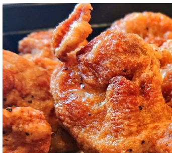
Fried Chicken 炸鸡 후라이드 치킨 からあげ 2 pieces 240円 5 pieces 580円